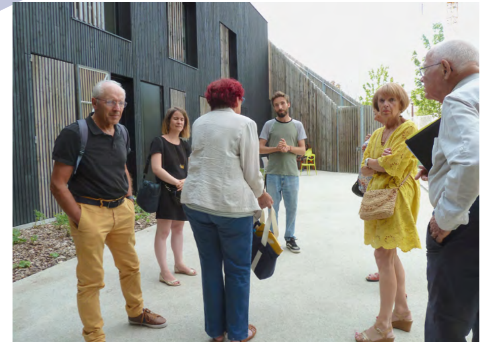
L'assemblée générale a permis à ses participants de visiter l'ensemble des 5 Ponts.

Logement Fraternité aide au logement par l'intermédiaire des associations partenaires. Une convention a été établie depuis longtemps avec l'entreprise d'insertion Envie 44 pour fournir de l'équipement en électroménager d'appartements. Les personnes bénéficiant de ces aides sont des résidents de CHRS et Pensions de famille, ou des personnes à qui il est proposé un appartement en « logement diffus ». Un certain nombre d'associations se sont adressées à nous en 2021 : Association saint Benoît Labre – Trajet – le Diaconat protestant - Arbre - Solidarité Estuaire – les Résidences soleil - SOS Femmes Vendée - AISL - CHRS de Loire-Atlantique. Alors que notre aide avoisinait les 10 000€ par an, dans les années 2010 à 2016 ; elle atteint aujourd'hui plus de 20 000€. Ce volet de nos activités représente 36% de la collecte contre 18 % auparavant.